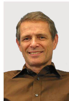
Robert Marti Informatik-Module IMS