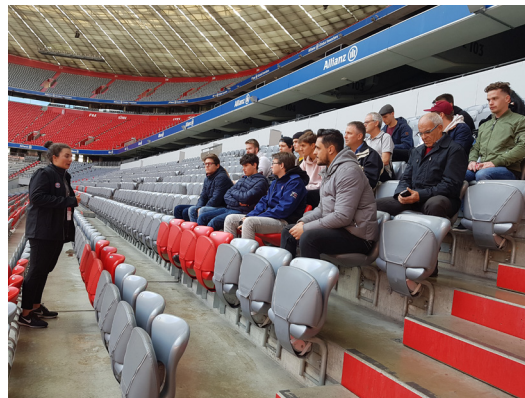
Lernende beim Besuch der Allianz Arena

Am Abend traf die gutgelaunte Schar wieder in Rapperswil ein. Die Reise ist sehr gut verlaufen, ohne jegliche disziplinarische Probleme. Die jungen Leute hinterliessen nicht zuletzt auch im Hotel einen sehr guten Eindruck – das hat uns alle sehr gefreut.